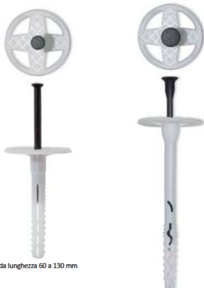
* da lunghezza 60 a 130 mm

Tassello in polietilene con chiodo in nylon caricato con fibra di vetro